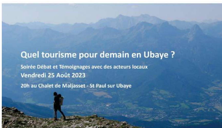
Un événement organisé dans le cadre de l'Ecotraversée 2023 en Haute-Ubaye. Infos : Ecotraversee-alpes.fr

Une soirée dédiée à la transition du tourisme en Ubaye a été organisée au Chalet alpin de Maljasset avec la présence d'acteurs locaux.